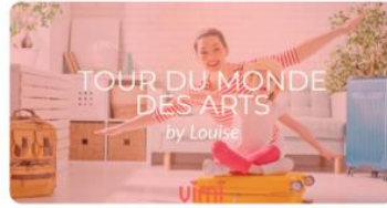
Tour du monde des arts