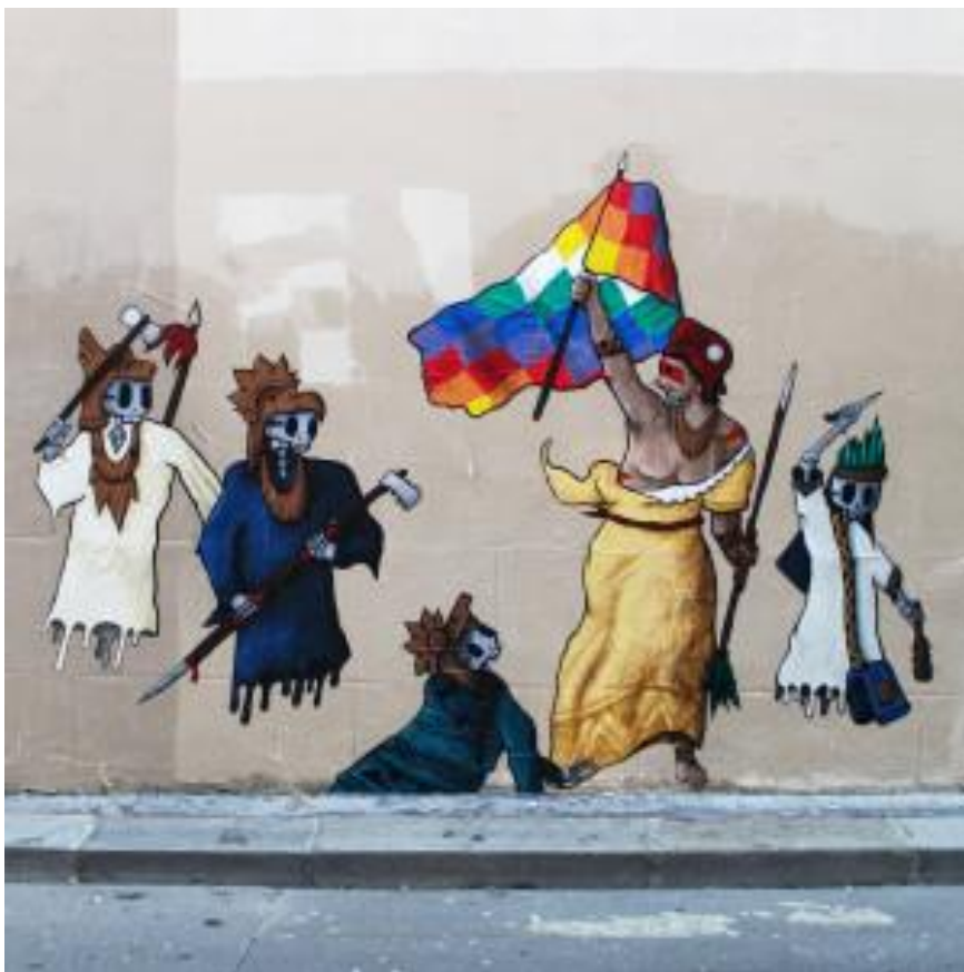
"La Libertad guiando al pueblo" Rue de la Ville-Neuve, 75002 Paris

Mon travail commence d'abord dans la rue, car je pense qu'avec le message que je veux faire passer, il est important d'investir l'espace public pour parler directement aux gens.