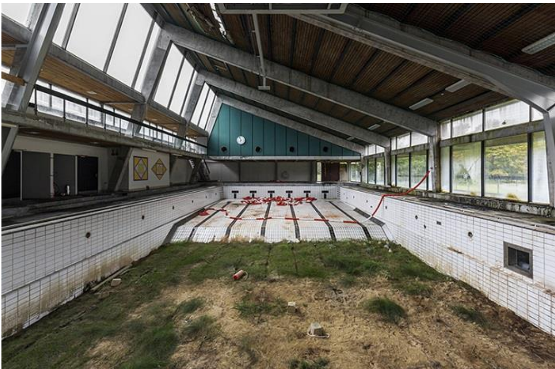
Piscine au Danemark

Nous sommes encore loin de l'engagement nécessaire pour faire réellement bouger les choses, mais elles vont clairement dans le bon sens. Des millions d'initiatives voient le jour, positives et fédératrices. J'espère que mes photos et le message qui les accompagnent apporteront une petite pierre à l'édifice.