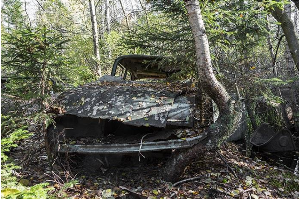
Cimetière de voitures en Suède

Jonk s'engage à sa façon, en parcourant les lieux abandonnés par l'Homme et repris par la Nature et en les diffusant accompagnés d'un discours écologique. Cet engagement le rend heureux. L'engagement rend heureux ! Il aime ce monde et il n'y a que l'amour qui sauvera la vie sur Terre."