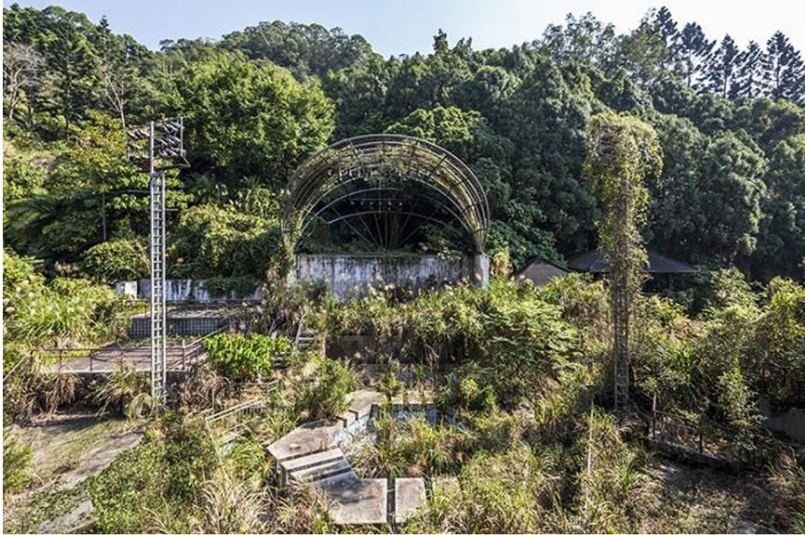
Scène de spectacle à Taiwan