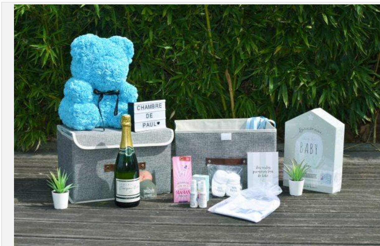
Le coffret Prestige Naissance

Mais pour rendre ce nouveau parent singulier et unique, The Creative Gift propose de créer un cadeau qui marque vraiment les esprits.