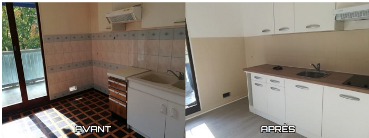
Rénovation d'une cuisine

C'est pour cela qu'Homys ne fait intervenir que des équipes qualifiées et professionnelles . Tous les travaux sont réalisés avec le plus grand soin, dans le respect des normes en vigueur. La qualité est toujours au rendez-vous !