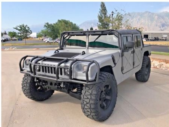
1992 CUSTOM HUMMER H1 HUMVEE (HMMWV)