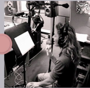
Et tous les autres ! Comédien.nes voix off