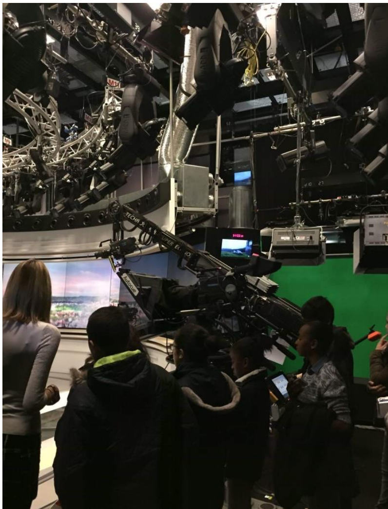
Les métiers de l'audiovisuel chez TF1