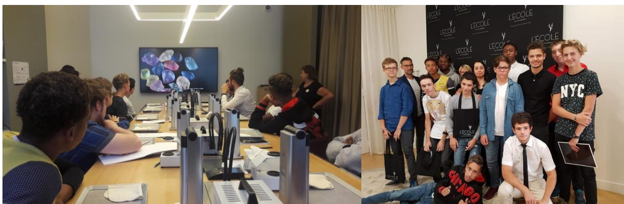
Visite et atelier "découverte du monde des pierres" à l'Ecole des Arts Joailliers avec le soutien de Van Cleef and Arpels