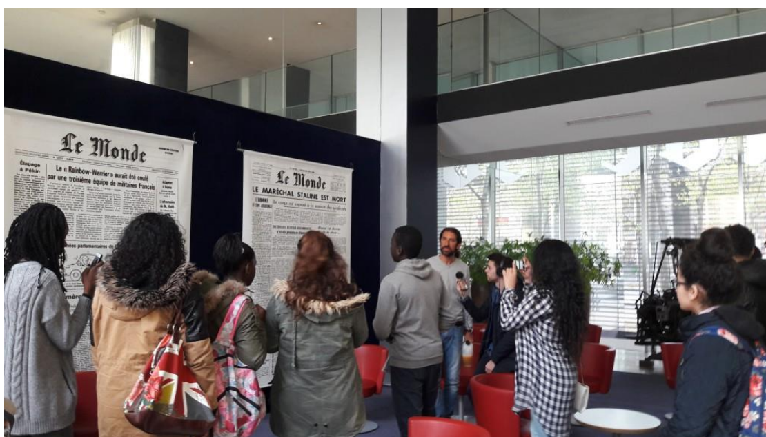
Les métiers du journalisme à la rédaction du Monde

Plusieurs de ces visites ont déjà éveillé des vocations et offert des opportunités à des jeunes.