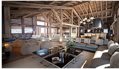
PERSPECTIVE 3D INTERIEURE