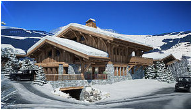
PERSPECTIVE 3D EXTERIEURE