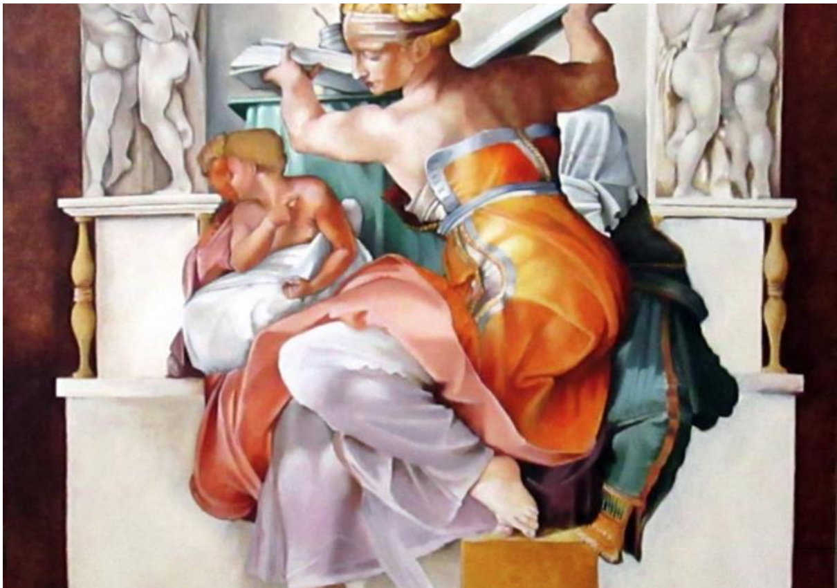
Ci-dessus la peinture de Dominique Urso

https://www.facebook.com/events/1094186053980146/