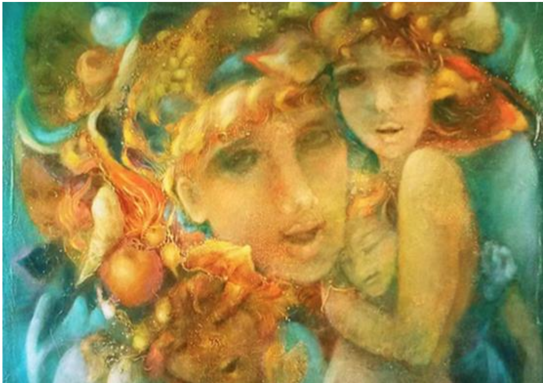
Ci-dessus la toile de Marie-Claire D'ARMAGNAC - copyright ADAGP Paris 2016