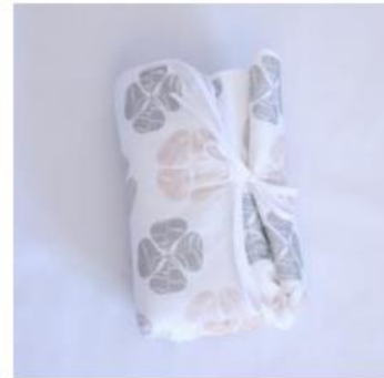
Tapis à langer nomade

- la collection Bulles , pour une chambre en couleurs : comprend une turbulette, un doudou, un tapis à langer nomade, un tour de lit, un édredon, un nid d'ange, un linge imprimé.