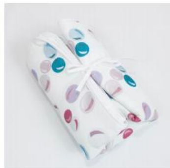
Tapis à langer nomade