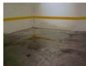
Dégat des eaux

Or, à l'arrivée de l'hiver, les problématiques liées à l'humidité sont considérablement amplifiées, d'une part en raison des conditions météorologiques et de la baisse des températures, et d'autre part parce que nous passons plus de temps à l'intérieur mais aérons moins les maisons et appartements.