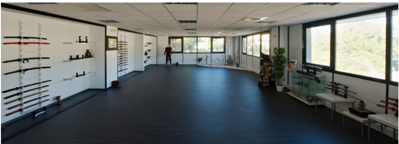
Vue panoramique de l'ambiance « Japon & katana » : 100 m 2 pour découvrir et essayer les katanas et iaitos